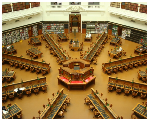
維多利亞州立圖書館