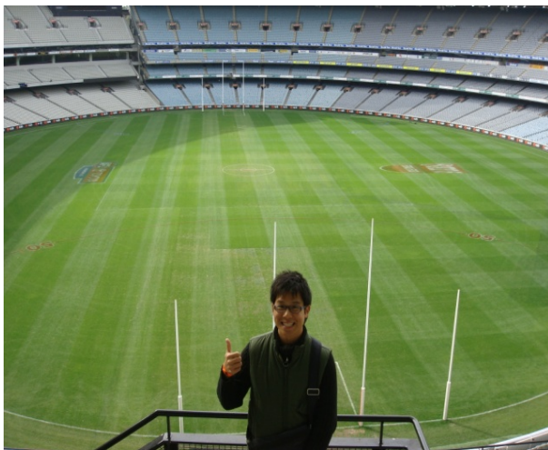
曾是奧運舉辦場地的墨爾本板球體育場