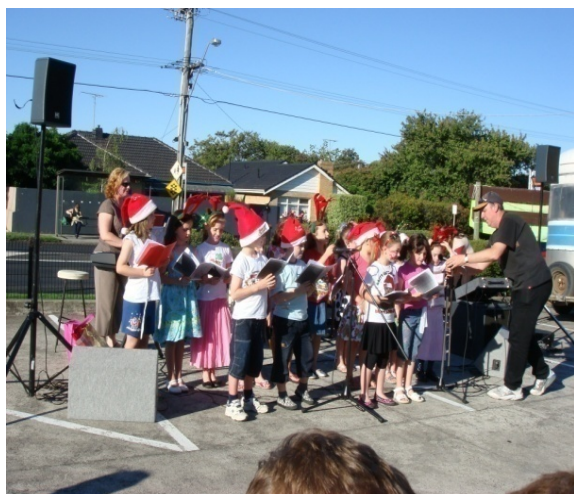
可愛的小朋友們在耶誕節唱聖歌