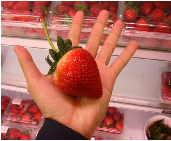
絕對不是我的手太小